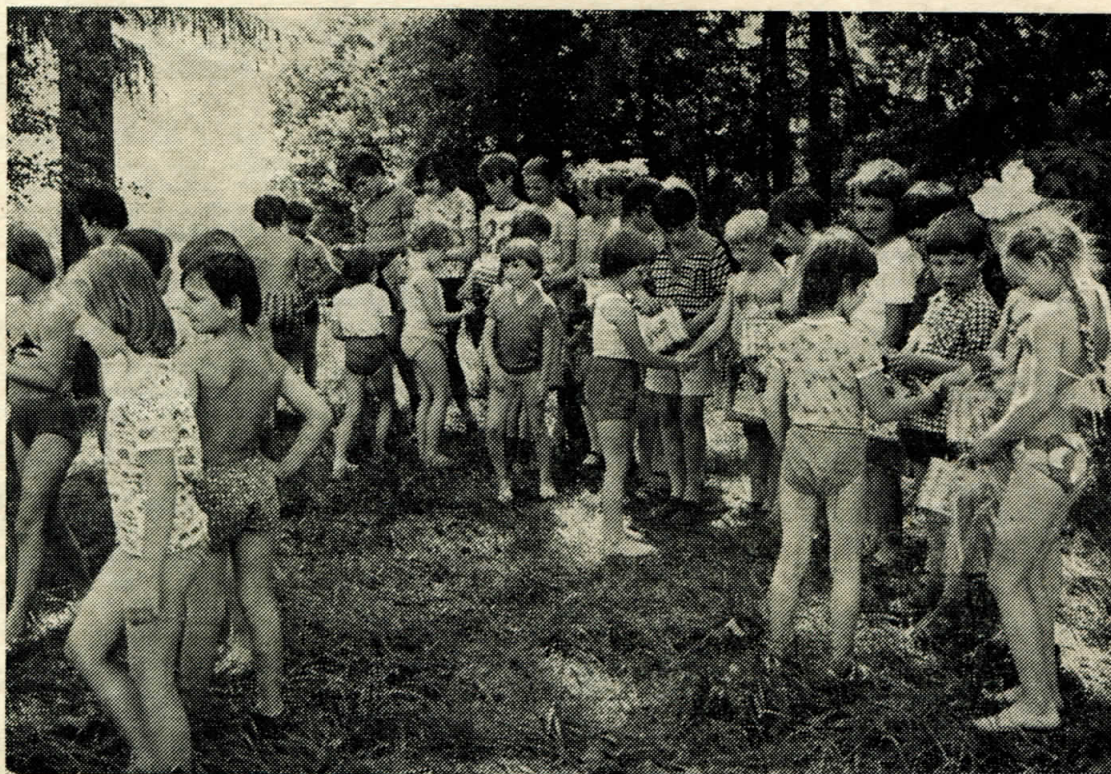
Družba mezi našimi a sovětskými dětmi u příležitosti Dětského dne.